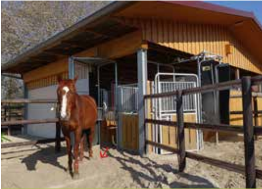
Compident Horse- Kraftfutterstation