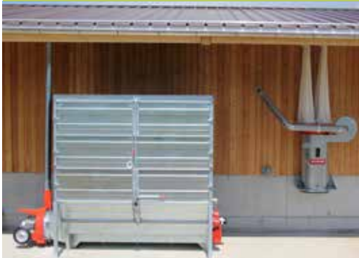
Strohmatic - Einstreusystem