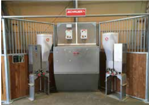
CombiFeed - Boxenfütterung