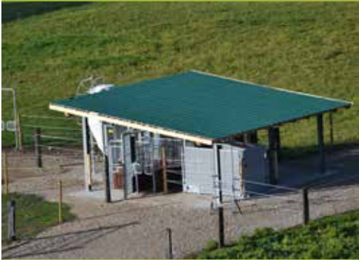
Compident Horse- Raufutterstation